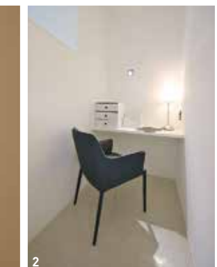
1/大開口の窓が奥行きのある広々としたLDKを演出。リビングと一体感を持たせたテラスには屋外用ソファを置き、リゾート気分が楽しめる 2/カウンター付きワークスペース 3/全面ミラーと大きな洗面カウンターでホテルライクな雰囲気 4/ミストや肩湯でリラックスできるバスルーム (見開き頁の写真は全て「with mama resort」)