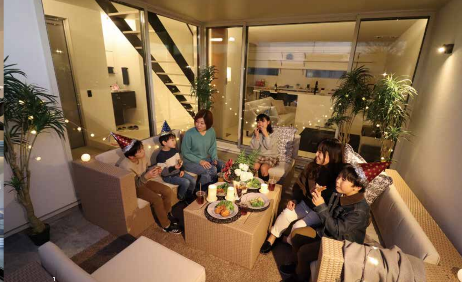
家に居ながら「ソト」を感じ、リゾートの雰囲気を楽しめるモデルハウス「with mama resort」。おうち時間が増えた今、「暮らすこと」そのものを大切にしたい住まいである